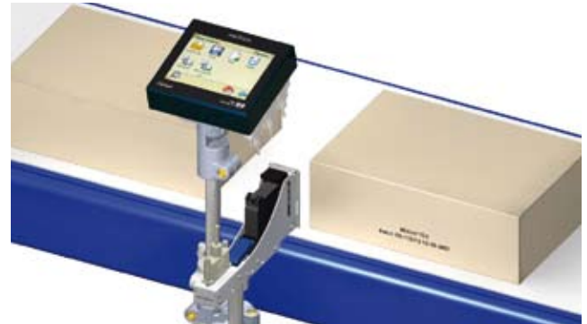
Die Befestigungsstützen wie oben abgebildet sind in verschiedenen Konfigurationen erhältlich.