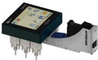
MT-HP4 kompakte Einheit mit 1-pen Druckkopf (1/2")

Zu beachten ist, das für den MiniTouch Controller nur die neuen F-Druckköpfe anwendbar sind.